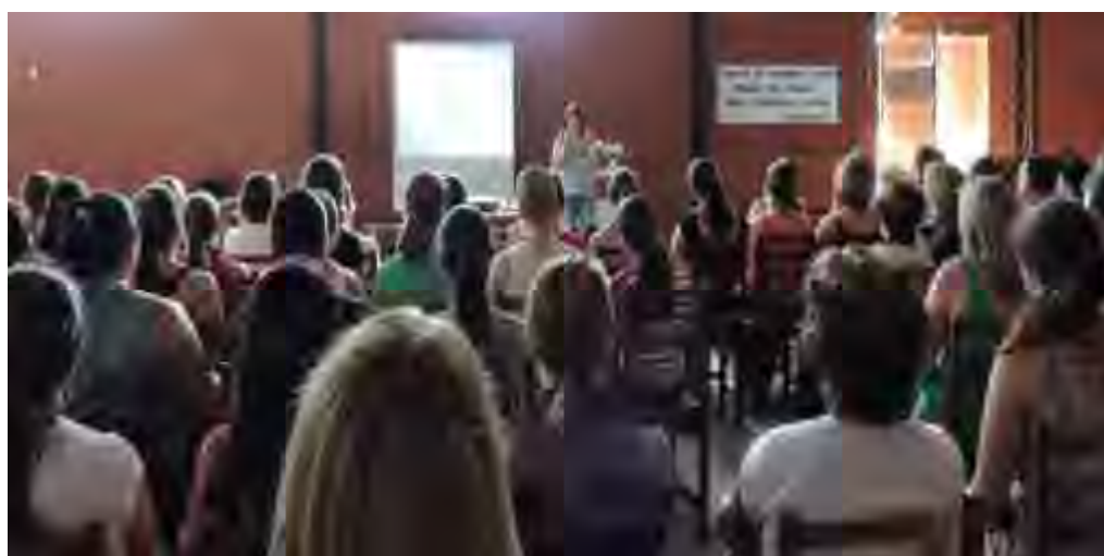
Imagens do Encontro do dia 16/12/14 sobre a Lei 13.005/14 do PNE, estudo do mesmo e pesquisa do Diagnóstico do Município para elaboração do PME.