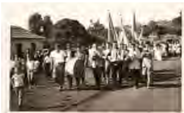
Ilustração número 01