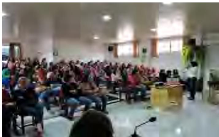
Imagens da audiência pública, dia 10/06/15, na Câmara de Vereadores de P. do Vale/RS